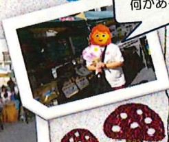
カルチャアロードの様子

実りの秋、今月もイベントが大成功に終われるようN-STAGEみんなで力を合わせて頑張